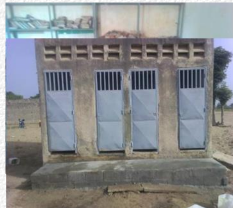
De toiletten voor en na