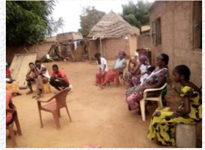
Ook vrouwen bij het overleg!

Voor meer details raadpleeg onze website: http://www.dropafrika.be . We mochten voor dit project van GROSA (Gemeentelijke Raad voor ontwikkelingssamenwerking Aarschot) een toelage ontvangen waarvoor onze dank