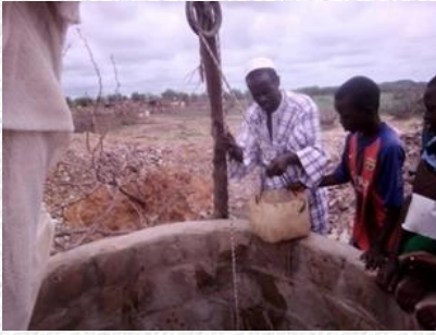
Nu nog manueel