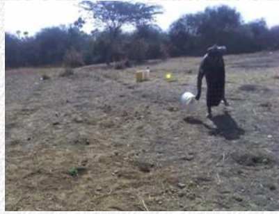
Begieten met een emmertje