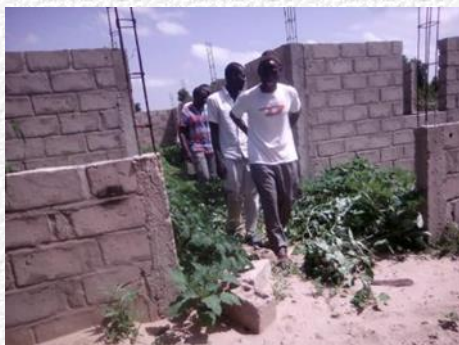
Het verblijf van de leerkrachten: september 2018