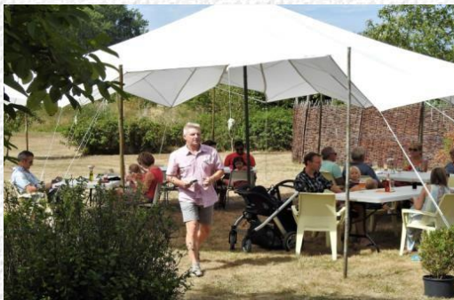
"Aarschot Fietst" – "Heerlijk zomers genieten"