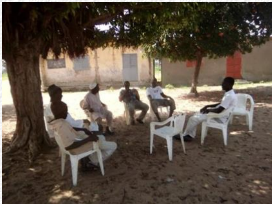
Alles wordt in gereedheid gebracht voor het overleg in de schaduw onder de boom natuurlijk

Omdat we net voor het begin van het schooljaar stonden heeft D.R.O.P meteen actie ondernomen en het meubilair laten herstellen en de toiletten in orde laten maken. Dit gebeurde uiteraard in overleg en in samenwerking met de school- en dorpsgemeenschap.