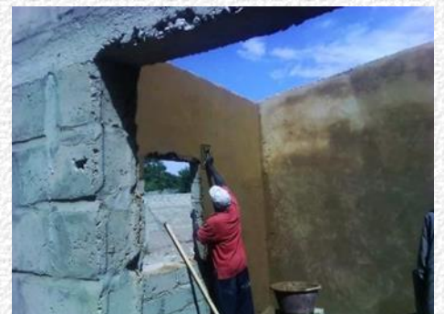
Februari 2019: pleisterwerken. De ramen zijn besteld