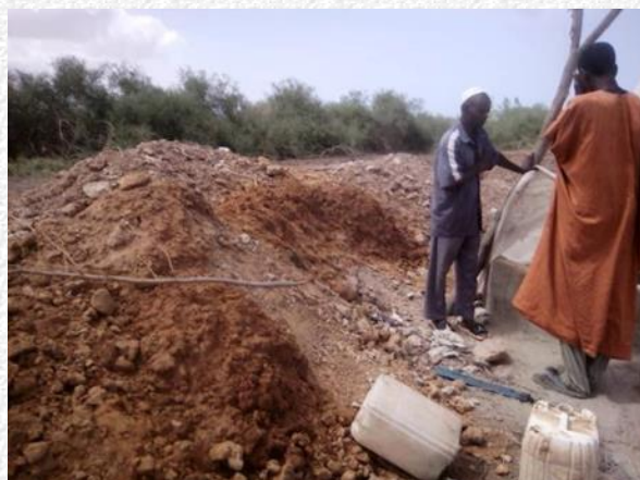
Een enorme berg puin