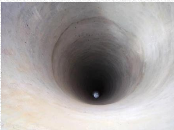
Bangelijk diep uitgegraven met de schop