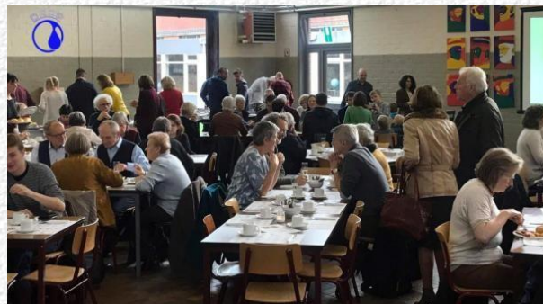
Op een donkere dag "heerlijk winters brunchen"